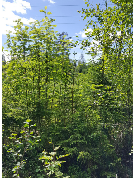
Kuva 3. Reunavyöhyke uudistuu luontaisesti. Taimikonhoidossa poistetaan etukasvuiset lehtipuut.

Reunametsän taimikko on muutoin syytä hoitaa normaalimetsän tapaan. Taimikonhoidossa tulee suosia havupuita ja erityisesti etukasvuiset lehtipuut on syytä raivata pois. Kunnolla ja ajois-