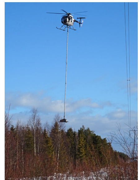
Kuva 4. Latvasahaus on hyvä menetelmä, kun vain osa puusta vaatii lyhentämistä.

Voimajohdon omistajalle latvojen helikopterisahaus on mahdollinen menetelmä niille voimajohdoille, joissa suurin osa on nuorta kasvatusmetsää. Puuston hoito taimikkona ja ajoissa tehty ensiharvennus antavat parhaat edellytykset helikopterisahaukseen.