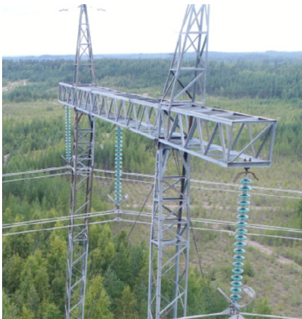
Kuva 2. Suurjännitejohdon tunnusmerkit.