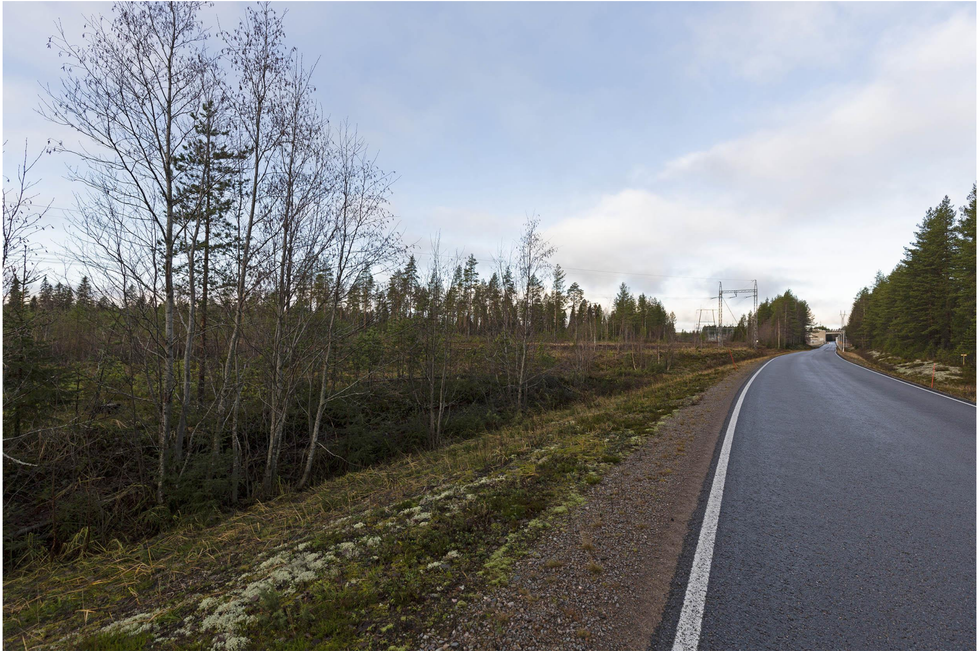
Kuva B. Näkymä nykytilanteesta Jylhämäntieltä.