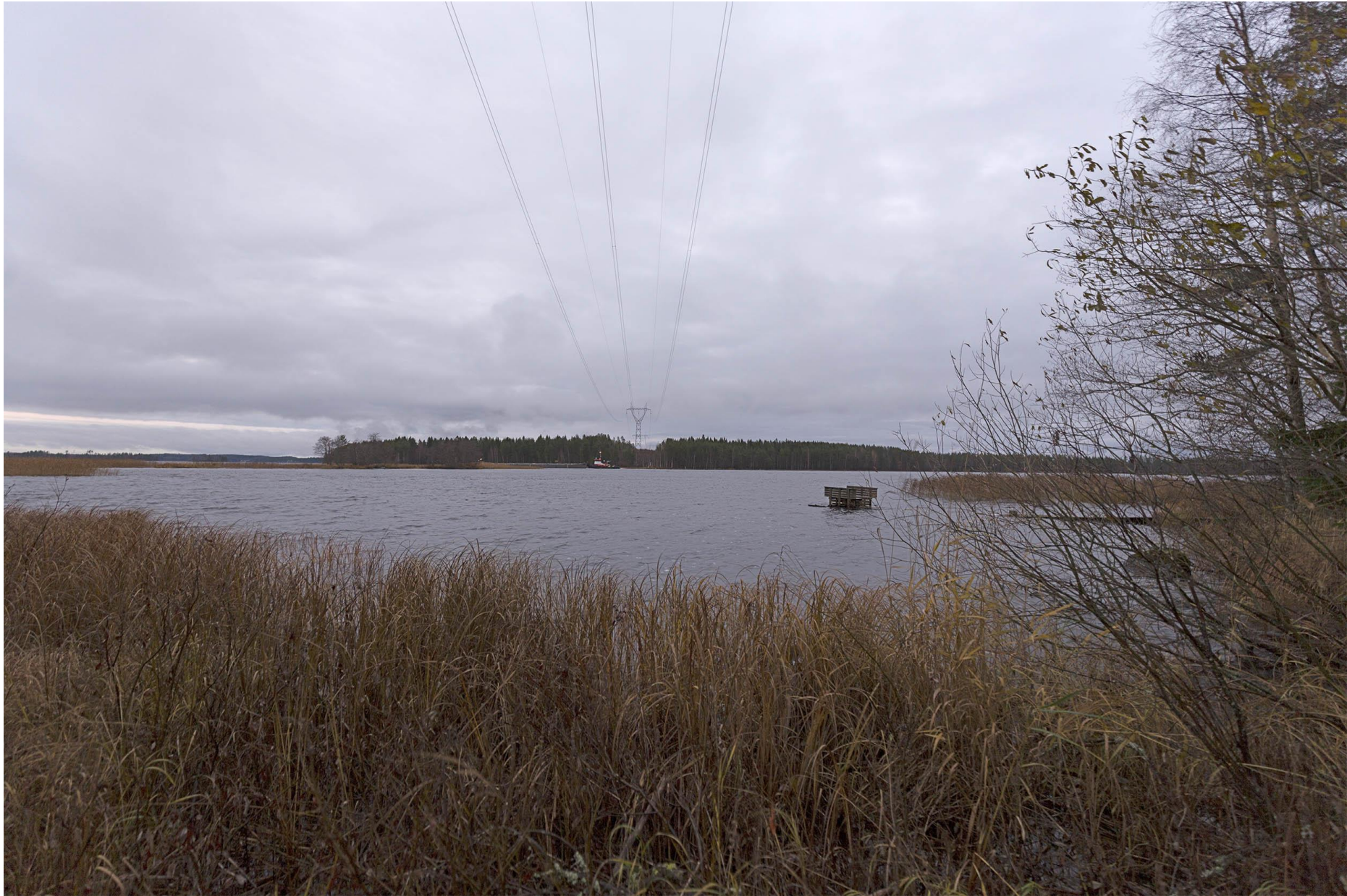
Kuva 1. Näkymä nykytilanteesta Kallaveden ylityskohdassa.