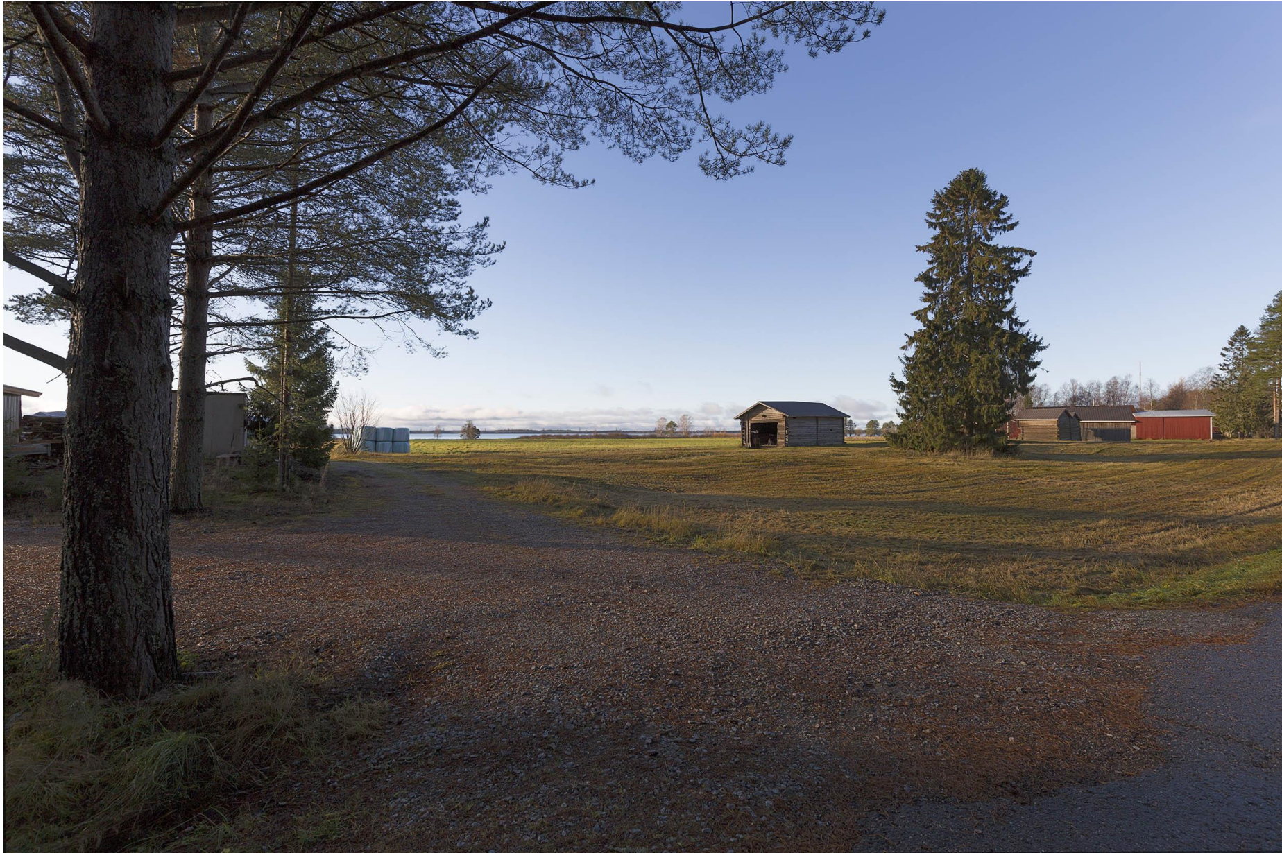
Kuva D. Havainnekuva Säräisniemeltä kohti voimajohtoa. Voimajohdot näkyvät heikosti kuvan keskellä horisontissa.