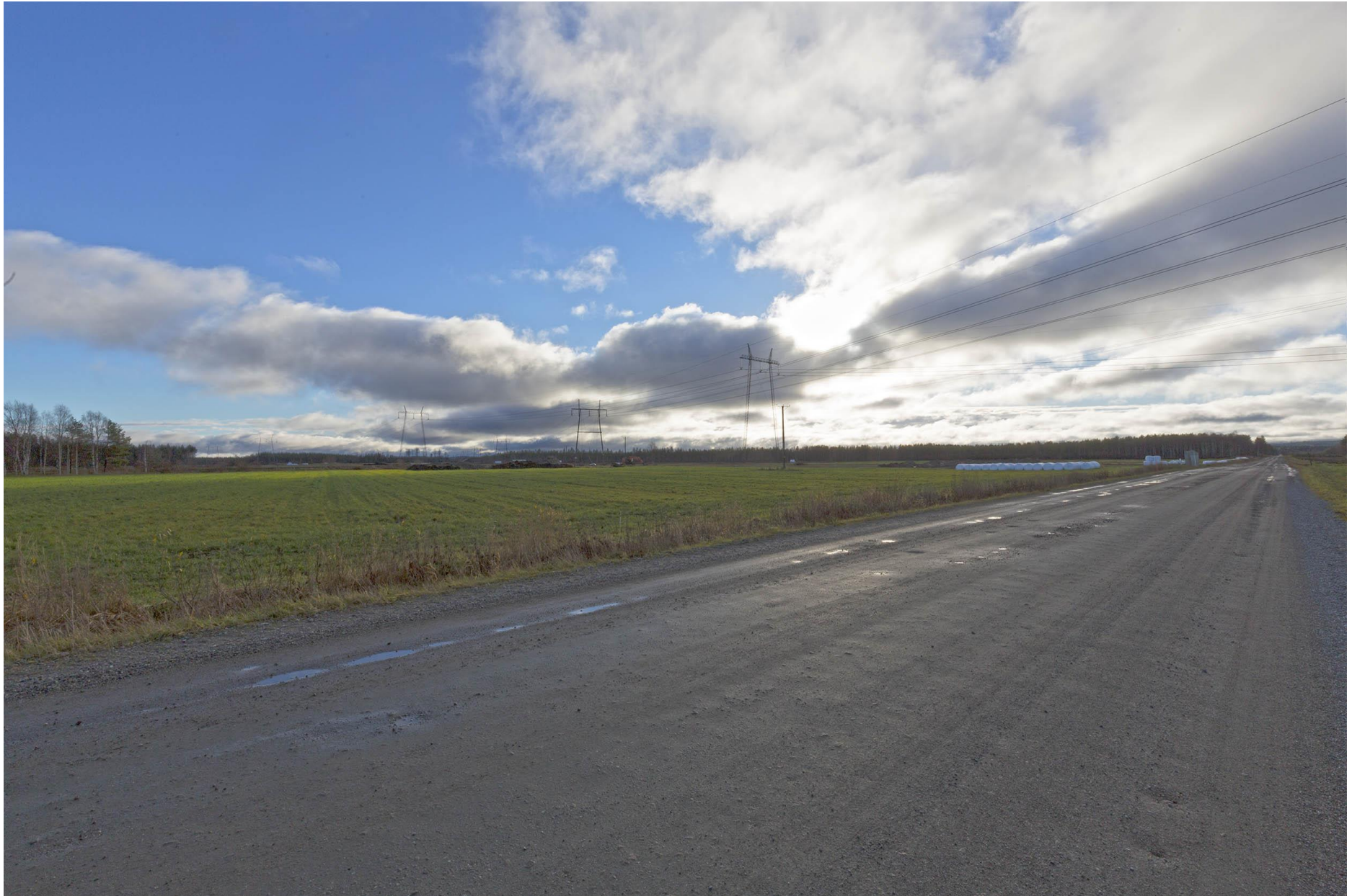
Kuva E. Näkymä nykytilanteesta Vuolijoella.