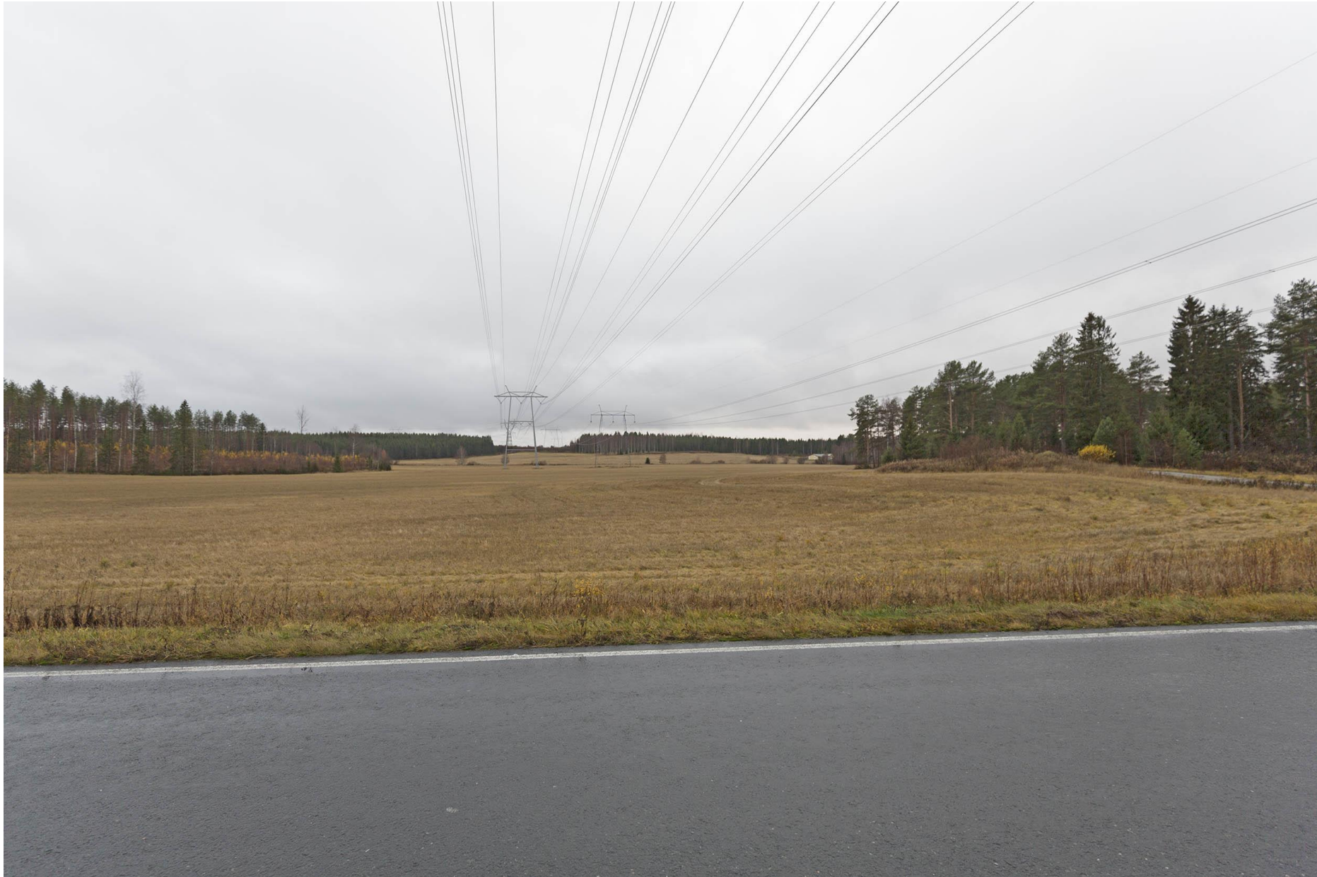
Kuva G. Havainnekuva Väänälänrannan peltoaukean yli. Uusi voimajohto on kuvassa vasemmalla puolella.