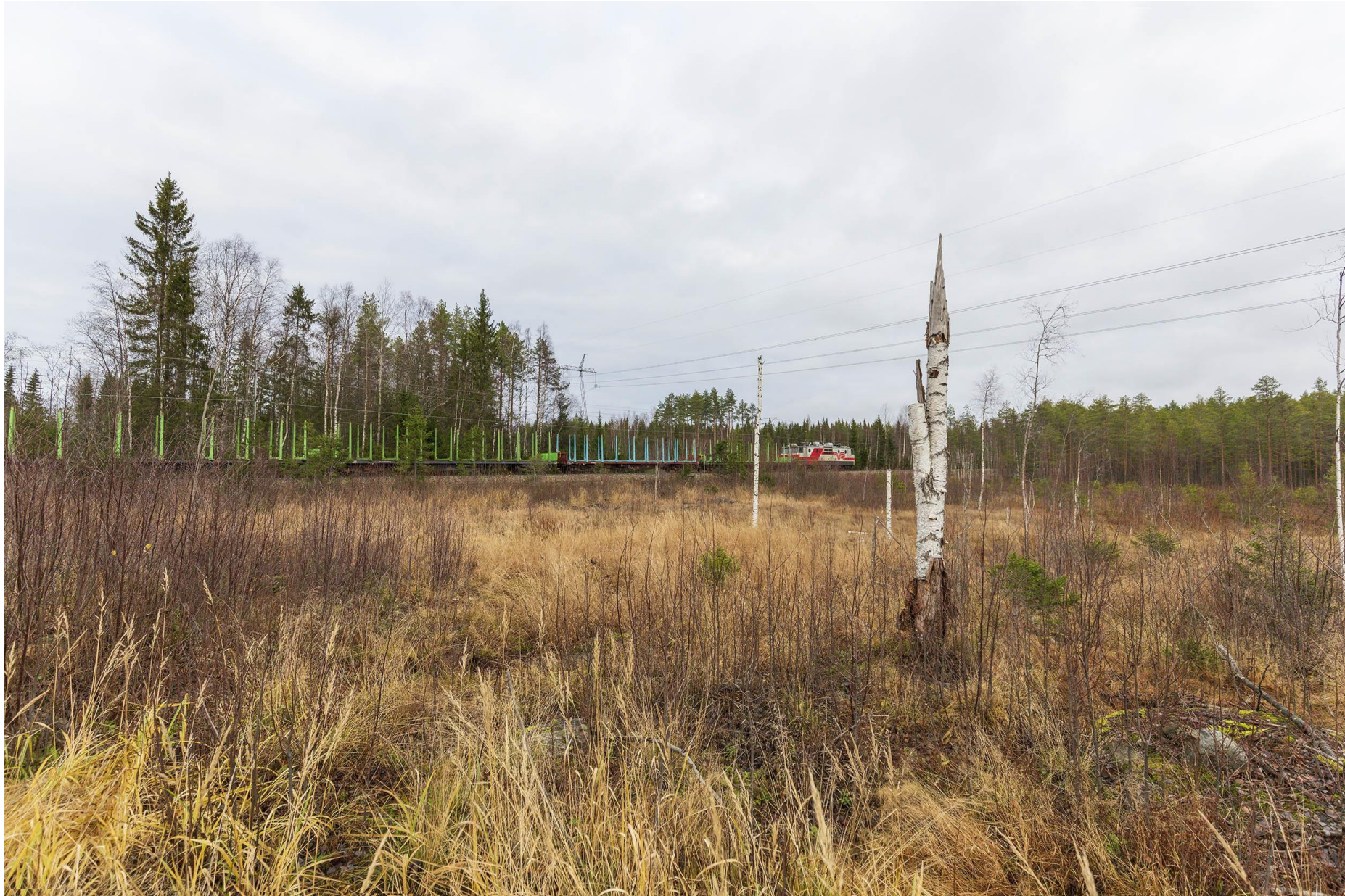
Kuva J. Näkymä nykytilanteesta radan ylityskohdassa.