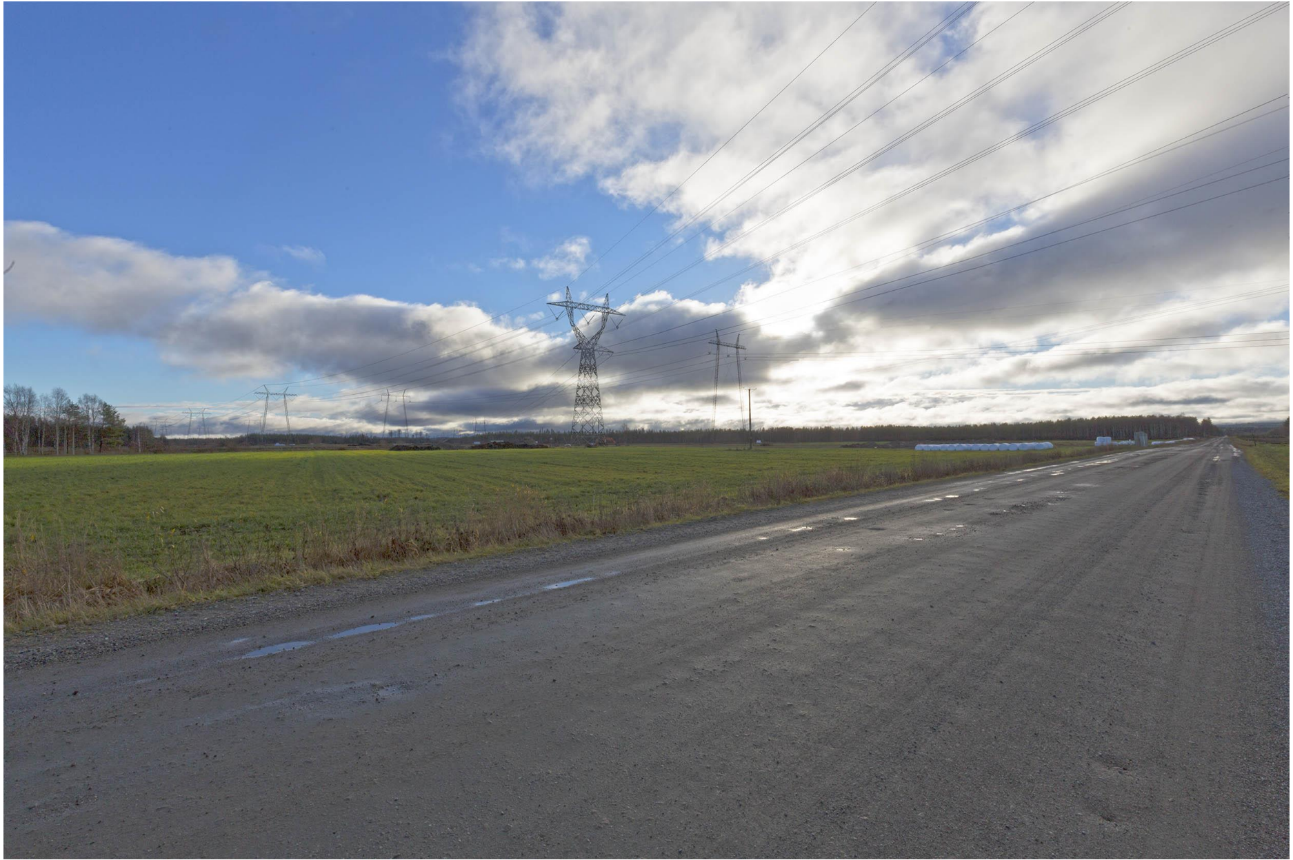
Kuva E. Havainnekuva Vuolijoella. Uusi voimajohto vasempana Y-pylväessä.