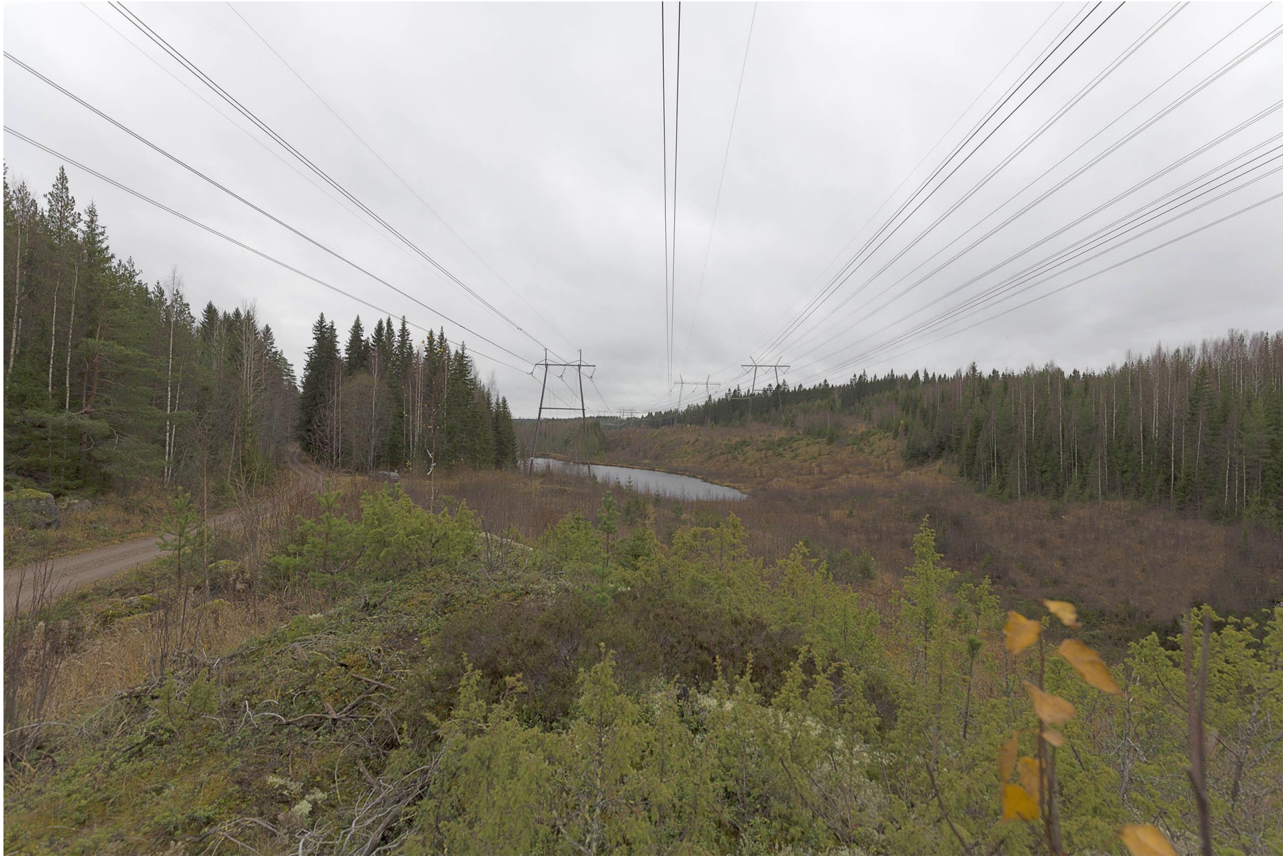
Kuva K. Havainnekuva Vihta-Mustan kohdalta läntisessä vaihtoehdossa. Uusi voimajohto näkyy oikealla puolella.