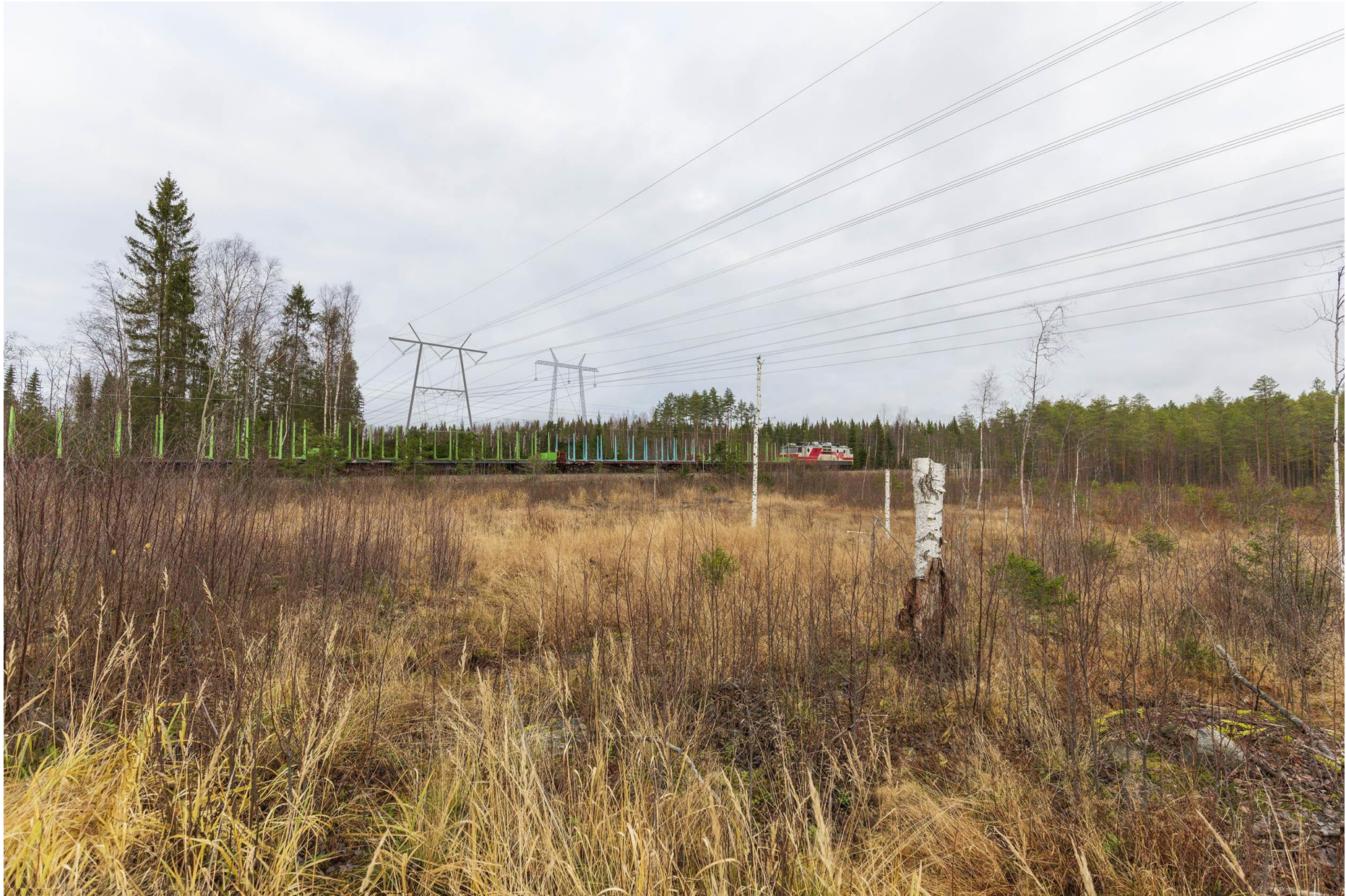
Kuva J. Havainnekuva radan ylityskohdasta läntisessä vaihtoehdossa. Uusi voimajohto näkyy vasemmanpuoleisena.