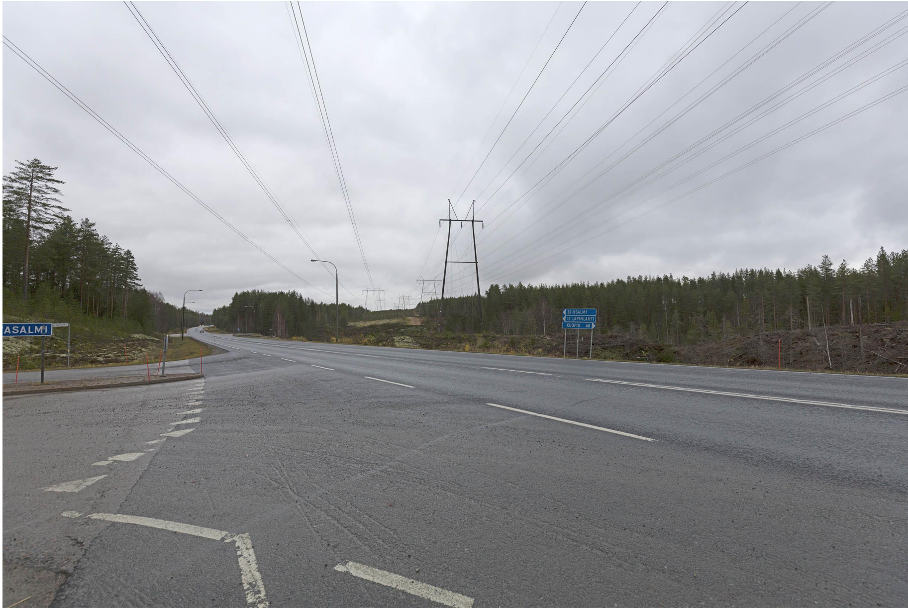
Kuva F. Havainnekuva VT5 yli. Uusi voimajohto oikealla puolella.