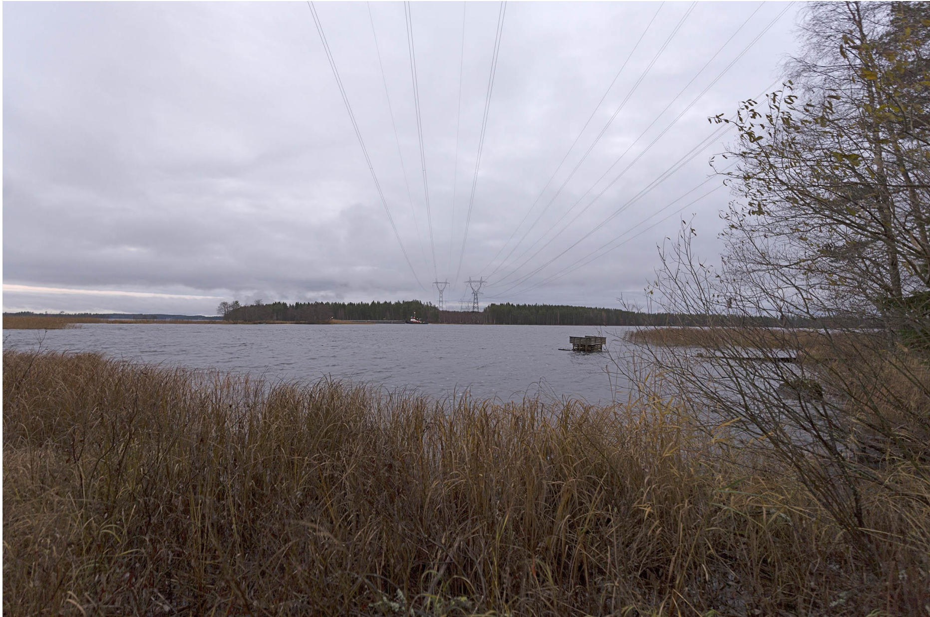
Kuva I. Havainnekuva Kallaveden ylityskohdasta. Uusi voimajohto näkyy oikeanpuoleisena.