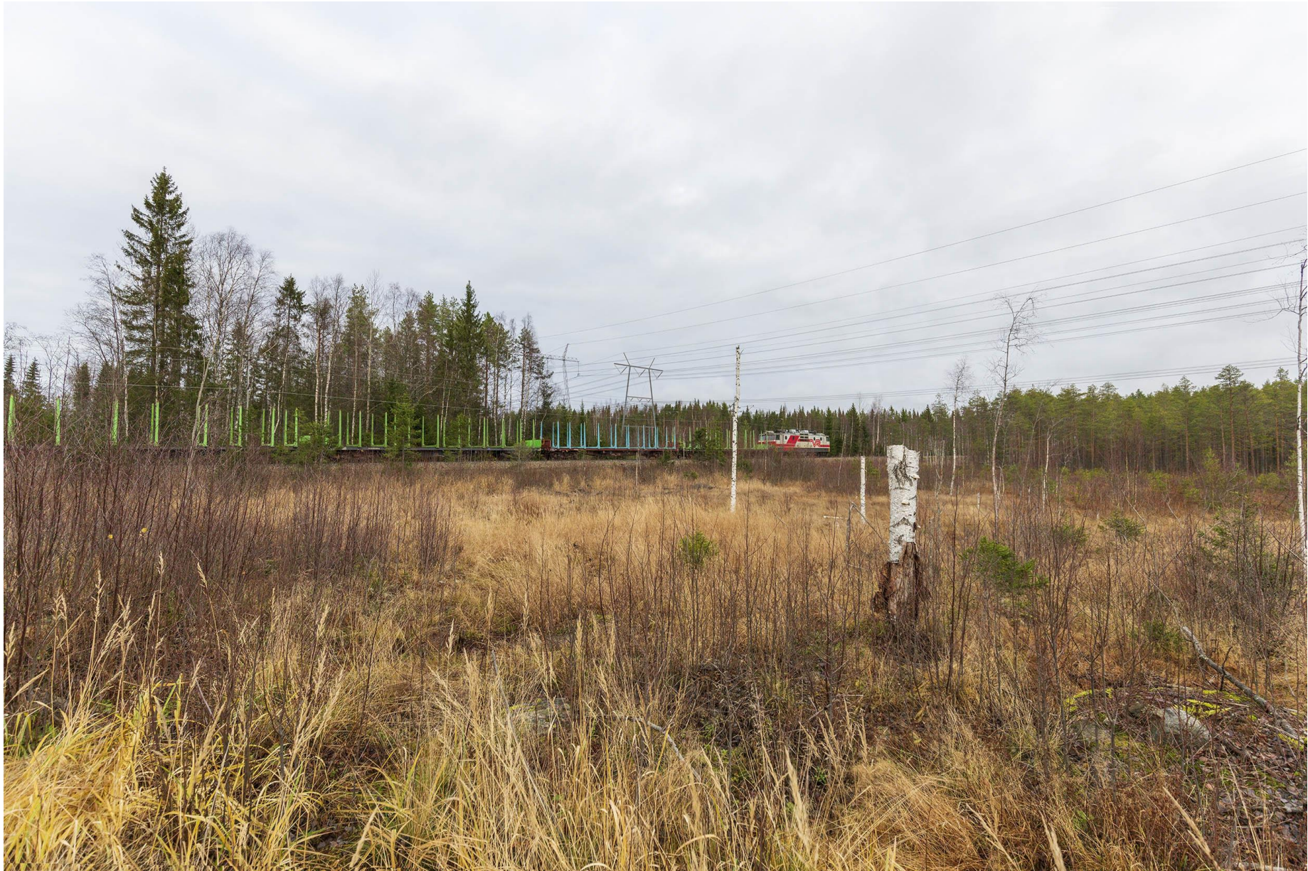
Kuva J. Havainnekuva radan ylityskohdasta itäisessä vaihtoehdossa. Uusi voimajohto näkyy oikealla puolella.