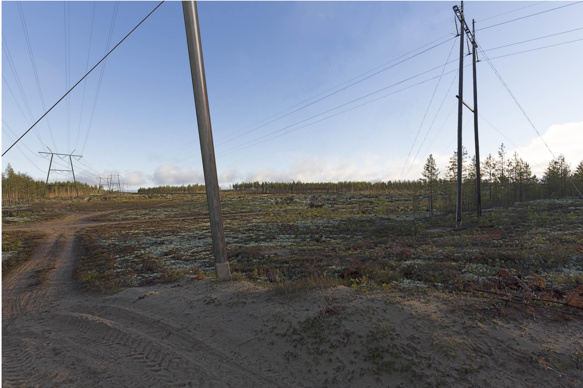
Kuva C. Havainnekuva Keisarintien ylityskohdasta. Uusi voimajohto näkyy vasemmalla puolella.