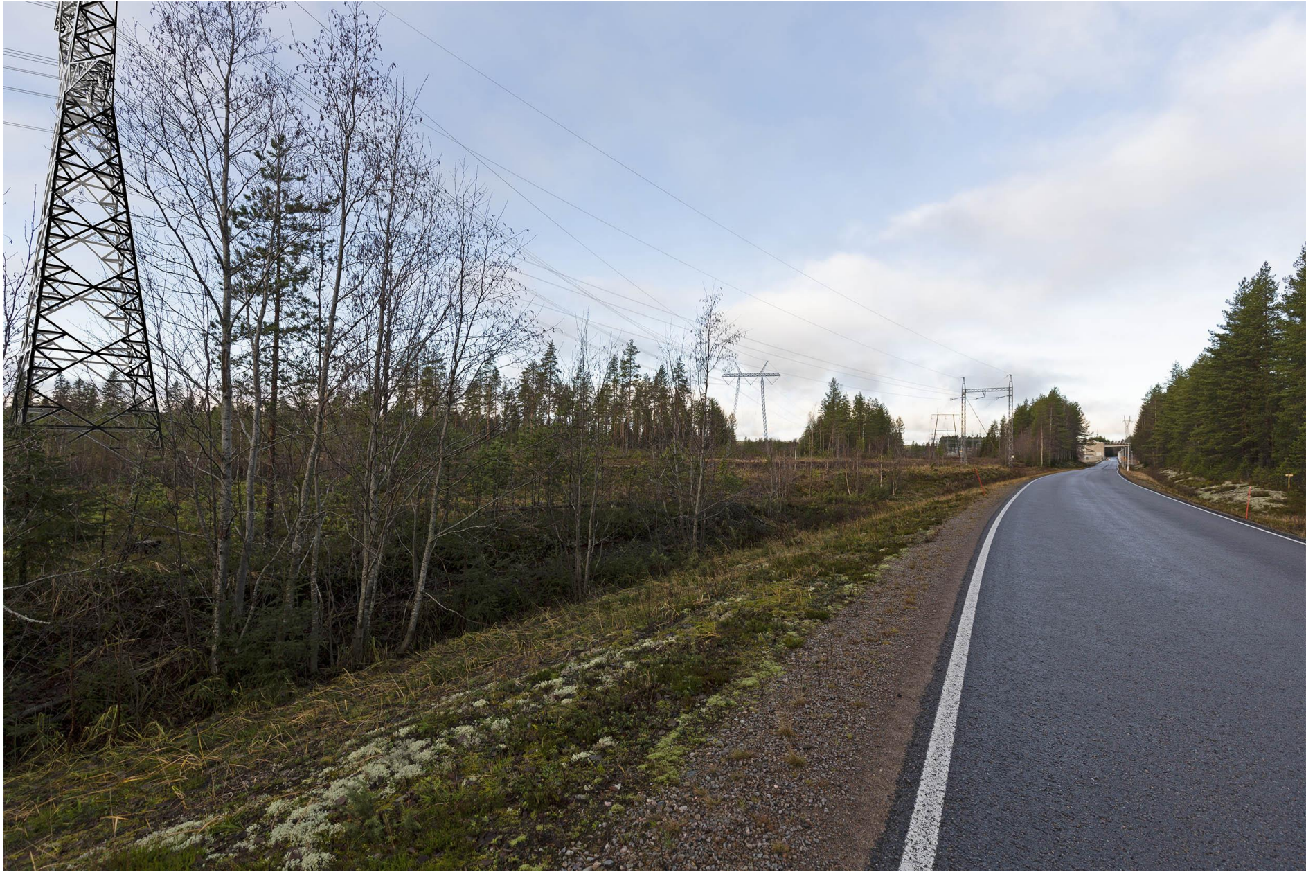
Kuva B. Havainnekuva Jylhämäntieltä. Vasemmalla näkyy uusi 400+110 kilovoltin Y-pylväs, josta 400 kilovoltin johdot kääntyvät vasemmalle kuvan keskellä.