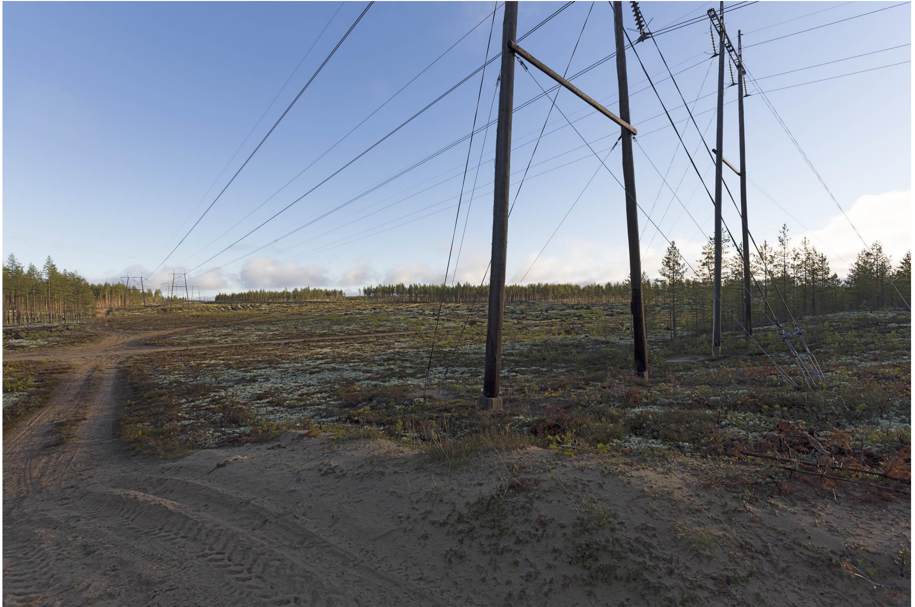
Kuva C. Näkymä nykytilanteesta Keisarintien ylityskohdasta. Keisarintie kulkee poikittain kuvan keskellä.