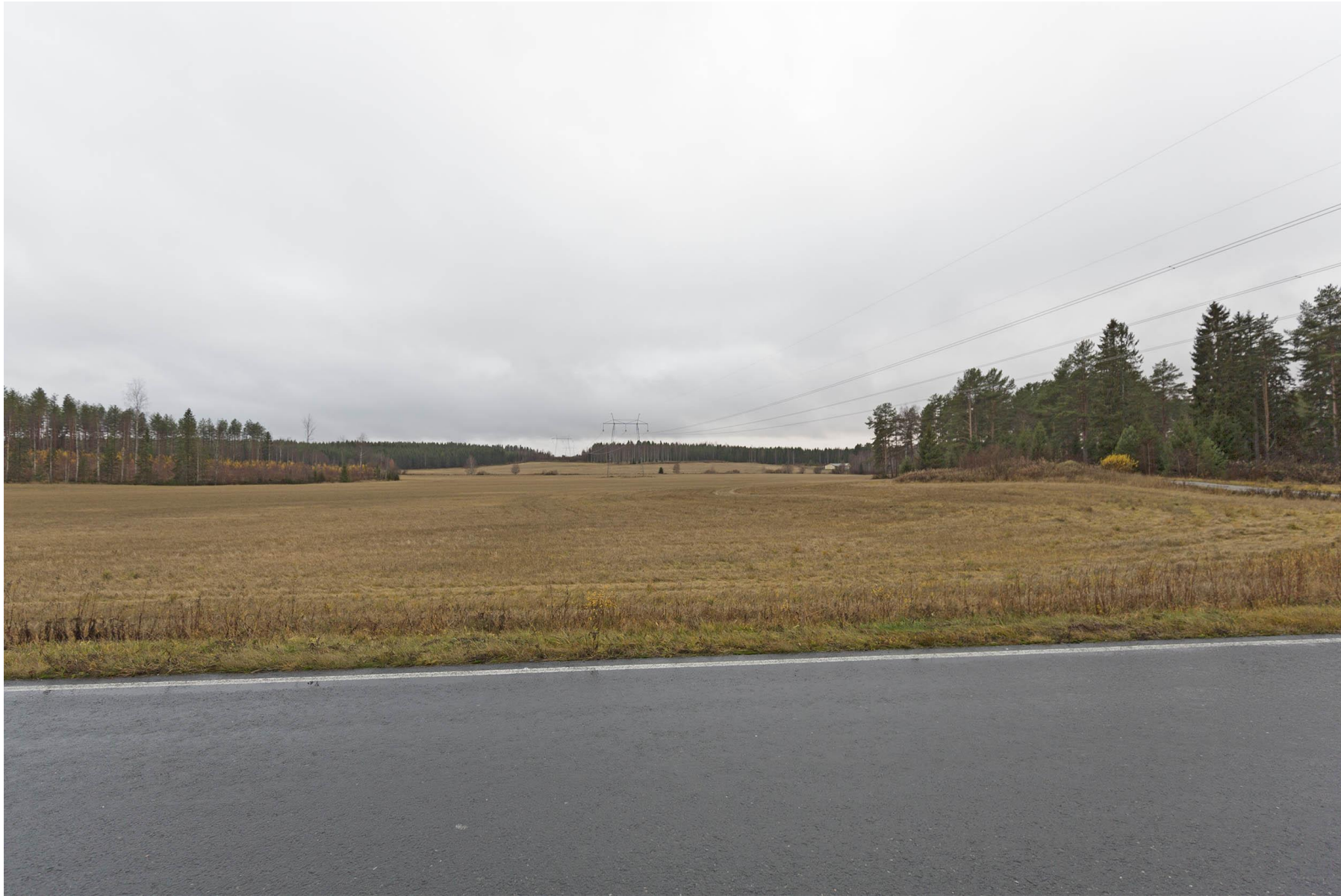
Kuva G. Näkymä nykytilanteesta Väänälänrannan peltoaukean yli kohti etelää.