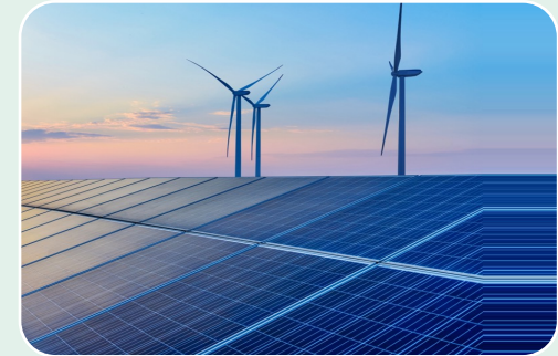
Uudet ratkaisut, kuten varastointi ja vety