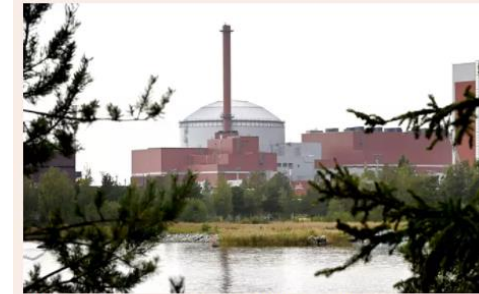
Olkiluodon ydinvoimala Eurajoella.

Aloitussajankohtaa siirrettiin myös aiemmin tässä kuussa.